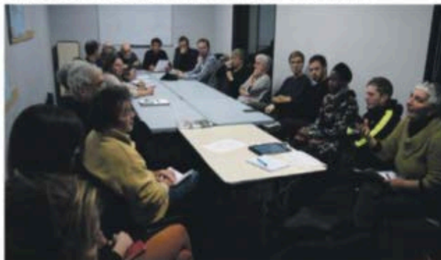
Une réunion d'usagers du vélo traitée sous pour la création de l'association.

Parmi les attentes du collectif, des aménagements concrets et sains, des crochets pour attacher les vélos, des garages sécurisés positionnés à des endroits stratégiques comme les parkings, les routes ou les parkings, le développement des déplacements multimodaux (vélo + bus ou train) et des actions de prévention pour la sécurité de la circulation et le respect des usagers. « Nous attendons également que dans tout projet d'aménagement de la voirie au niveau communal ou au niveau de la Communauté d'Agglo-