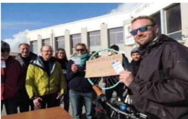
Un vélo, une carte d'électeur, les accessoires pour l'opération « Votez vélo ».

D'après une étude récente réalisée par la Fédération française des usagers de la bicyclette (FUB), les deux préoccupations principales des cyclistes sont la sécurité et le vol. « Dans le Pays royannais, le