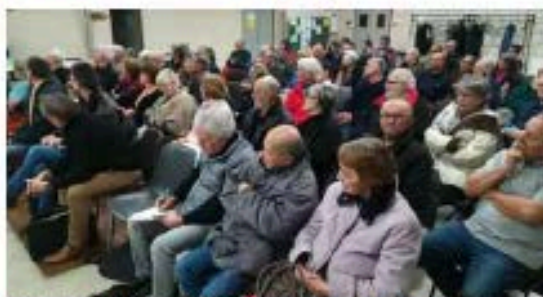
75 personnes étaient présentes lundi soir à la Maison des associations