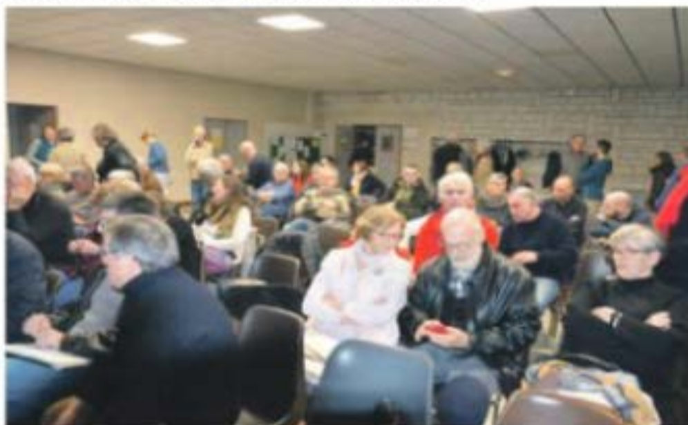
Les promoteurs de l'association ont réussi à rassembler dès la première réunion.

Les usagers du vélo disposent d'une association pour promouvoir une mobilité propre.