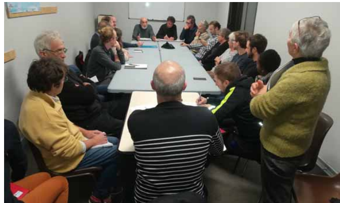
Une première réunion a réuni plus d'une vingtaine de personnes lundi dernier.

« On espère avoir des référents dans chaque commune et devenir un interlocuteur incontournable